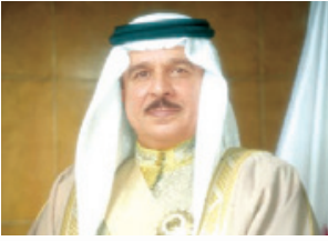
○ جلالة الملك.

جهاز المساحة والتسجيل العقاري رئيس مجلس إدارة مؤسسة التنظيم العقاري، المستشار عبدالله بن حسن البوعينين نائب رئيس المجلس الأعلى للقضاء رئيس محكمة التمييز، سمو الشيخ خالد بن علي بن عيسى آل خليفة نائب رئيس مجلس إدارة هيئة شؤون الخيل، خالد الرمحي الرئيس التنفيذي لشركة ممتلكات البحرين القابضة، سمو الشيخ خليفة بن علي بن عيسى آل خليفة نائب رئيس مجلس إدارة نادي الرفاع، الفريق عادل بن خليفة الفضل رئيس مجلس إدارة الجابري الوطني، الشيخ أحمد بن محمد آل خليفة رئيس ديوان الرقابة المالية والإدارية.