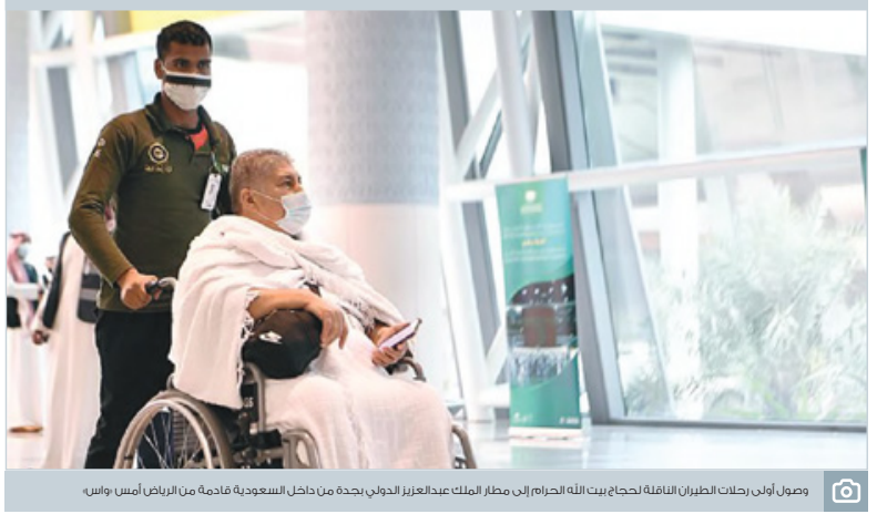
وصول أولى رحلات الطيران الناقلة لحجاج بيت الله الحرام إلى مطار الملك عبدالعزيز الدولي بجدة من داخل السعودية قادمة من الرياض أمس واس،

* ملاحظة: «قيم» هنا لا تعني مفهوم الثمن المرتفع للمبادئ، وقيمة لا تعني أننا نتحدث عن مبادئ قيمة، بل تعني مجموعة المبادئ التي بقدرها شخص ما، أو جماعة ما، بغض النظر عن قيمتها أو تقبلها عند الآخر.