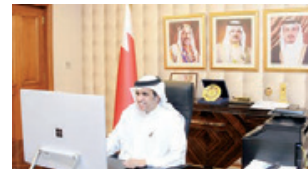
○ وزير الإعلام يترأس اجتماع مجلس أمناء معهد التنمية السياسية.

والتباحثين على المساهمة في البرامج التوعوية و٢٠٥٥ في التثقيف لأبناء المجتمع. بعد ذلك ألقى المجلس إلى متابعة خطة العمل المستقبلية والأطلاع على جدول الأعمال والبرامج التي سيقدمها المعهد خلال الفترة المقبلة من خلال الجاري، والمتمثلة بعدد من الأنشطة والفعاليات الممنوعة، بما يحقق الأهداف التي أضحى المعهد من أجلها.