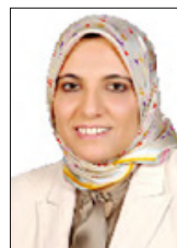
الدكتورة هيفاء محمود

توفيت يوم أمس المدير الطبي لمستشفى الدكتورة هيفاء للعيون، رئيس مركز د. هيفاء للجيوش والدراسات، الدكتورة هيفاء محمود. وبعد مستشفى الدكتورة هيفاء للعيون منشأة ذات مستوى عالمي بصن تركيزه على جودة الرعاية في مجال العيون بمساعدة تقنياتها المتطورة و فريقها الطبي المتميز. وتولدت الفقيده عدداً من الوظائف، إذ بدأت استشارية عيون في مجمع الشهادة الطبي من العام 2000 إلى العام 2002، وعملت نائب رئيس وإدارة أطباء العيون 2000-2002، وعملت مديرة عيون مسؤوله بمجمع أطباء العيون المقيمين بمجمع الشهادة الطبي 2000-2002. والفقيده حاصلة على شهادة البورد من مستشفى الملك خالد التخصصي للعيون