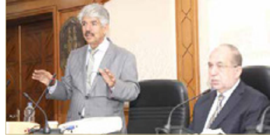
الأمين العام للمؤسسة الملكية للأعمال الإنسانية يقدم المحاضرة

الأساليب والنظريات الإدارية الحديثة التي تنتهجها المؤسسة في إدارة أعمالها مثل نظريتي "موسيف" و"كريموك" ومبادئ تنمية الشباب والمرأة، إذ تشمل هذه الإستراتيجيات جميع العناصر التي تعمل من خلالها المؤسسة لتحقيق النجاح ابتداء من القيادة والسياسة والإستراتيجية ووضع الخطط وتوفير الموارد المطلوبة وإدارة المشروعات والتخطيط وأساليب مهني علمي. وتبين في المحاضرة تاريخ تأسيس المؤسسة وأهدافها النبيلة التي رسها جلالته الملك حمد منذ 20 عاماً، وعدد الأيتام والأرامل المكونين من جلالته التعاون للمؤسسة من قبل الحكومة