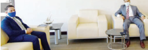
○ رئيس المؤسسة الوطنية لحقوق الإنسان يستقبل السكرتير الأول بمندوبية الاتحاد الأوروبي.

«الوطنية لحقوق الإنسان» و«مندوبية الاتحاد الأوروبي» تبحثان استمرار التعاون والتنسيق في المجالات الحقوقية